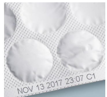
Die Wolke Drucker der m600 Serie bieten einen optimalen Kontrast, eine hervorragende Wasserbeständigkeit und eignen sich bestens für schwierige Trägermaterialien.

Telefon +49 6431 994 0 E-Mail info@videojet.de Internet www.videojet.de