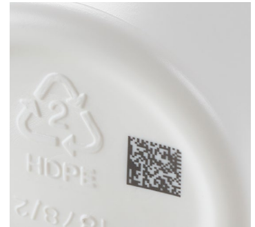
Im Videojet 7810 Laserkennzeichnungssystem kommen ultraviolette Wellenlängen bei der Erstellung dauerhafter, hochauflösender Codes auf HDPE-Verpackungen zum Einsatz.

Bei der Verpackung pharmazeutischer und medizinischer Produkte kommt es, in einem vielleicht noch größeren Ausmaß als in anderen Branchen, auf variable Kennzeichnungen in bester Qualität an. Im Hinblick auf die neue Gesetzgebung gilt dies umso mehr. Es kommt darauf an, mit einem Kennzeichnungsanbieter zusammenzuarbeiten, der seine Produkte im Hinblick auf aktuelle Herausforderungen konzipiert und gleichzeitig über das Know-how und das globale Netzwerk verfügt, um alle Projektanforderungen zu erfüllen.